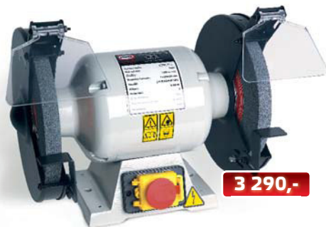
obj. číslo 25350200