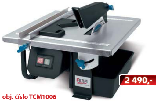
obj. číslo TCM1006