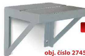
obj. číslo 27450000