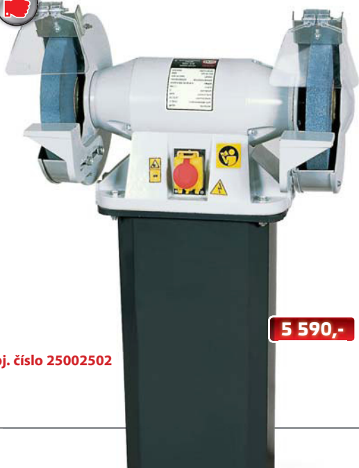
obj. číslo 25002502