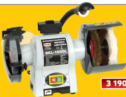
obj. číslo 25012004