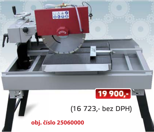
obj. číslo 25060000